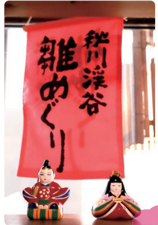
「雛めぐり」のつるし旗が参加店舗の目印です