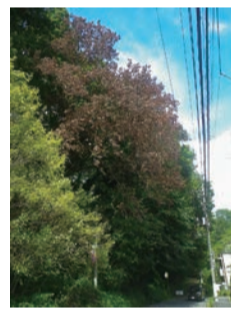
被害の樹木(画像上部)