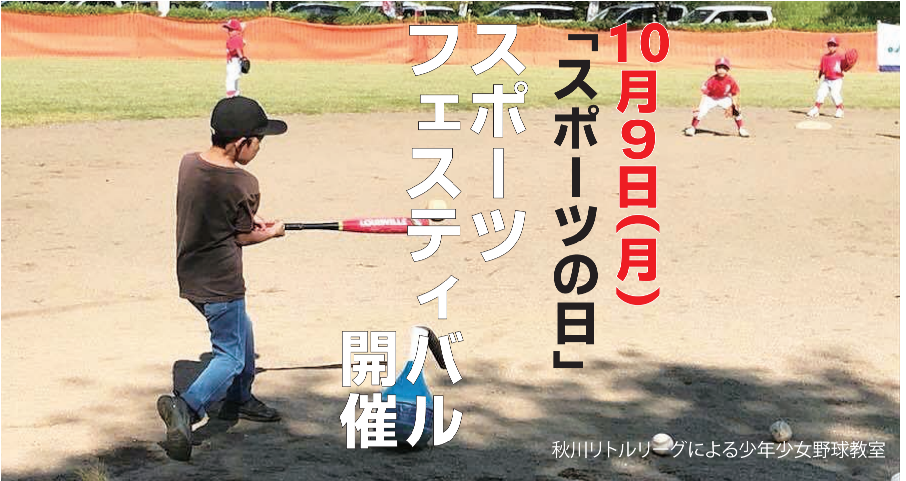
秋川リトルリーグによる少年少女野球教室

市では、自主的な健康活動のため、無料で体験できる市内スポーツ団体協働のスポーツプログラムや、各体育施設の無料の個人開放を行います。スポーツに興味のある方、これから始めようと思っている方、お気軽にご参加ください。