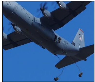
米軍機からの降下