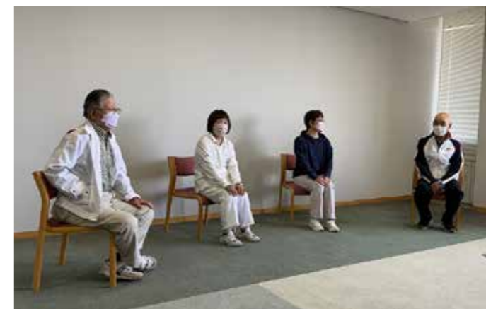
参加者の自由で活発な発言を促す観点から、氏名等の掲載は控えています。