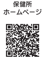
保健所 ホームページ

野菜を120g以上使ったメニューを提供しているお店が対象です。地域住民の方に向けて、お店の情報をホームページや野菜メニュー店MAPで発信していきます。