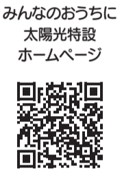
みんなのおうちに太陽光特設ホームページ

内 都では、太陽光発電設備と蓄電池の導入に係る都民の負担を軽減するため、共同購入によるスケールメリットにより購入価格の低減が期待できる「太陽光発電及び蓄電池グループ購入促進事業」の参加者を募集します。