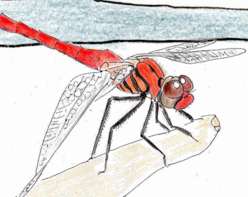
アキアカネとナツアカネ

赤トンボの代表格がアキアカネとナツアカネ。成熟すると鮮やかな赤色になり、特にナツアカネは顔まで真っ赤。夏の間、遠くの山に行っていたアキアカネが平地に戻ってくるこの時期は、赤とんぼの姿がより目立ちます。