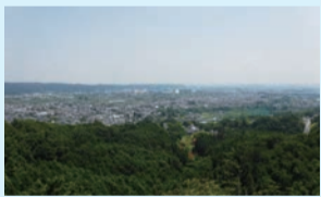
弁天山(山頂からの眺望)

武蔵増戸駅→夕日橋→弁天山→網代城山→前山トンネル→都立小峰公園(4.9km 所要時間約2時間)