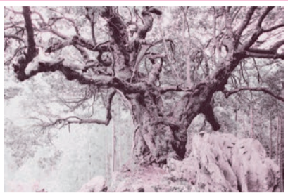
やまだ おおかし 山抱きの大榎

足利尊氏が創建したこの寺院にある樹齢400年を超えるヤマザクラは、都の天然記念物に指定されています。