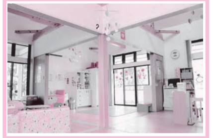
秋川流域病児・病後児保育室ぬくもり

子育て中の方が安心して子育てと就労の両立などができるよう、公立阿伎留医療センターの敷地内で病期中や病気の回復期にあるお子さんを預かる施設です。