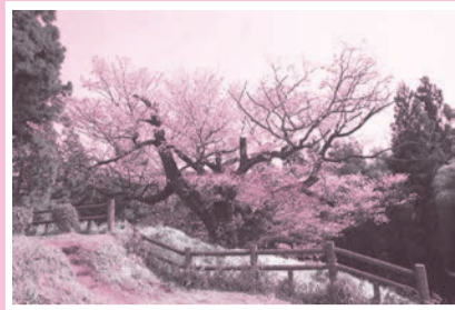
こうごんじ 光厳寺のヤマザクラ

足利尊氏が創建したこの寺院にある樹齢400年を超えるヤマザクラは、都の天然記念物に指定されています。