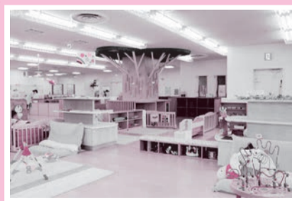
子育てひろば こころの

保育士が常駐している子育て支援施設です。木製遊具や手作りおもちゃなどの遊具を用意しています。子育て親子の交流や集いの場としてもご利用ください。