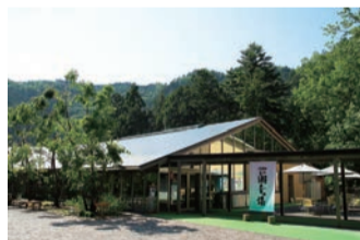
秋川溪谷瀨音の湯