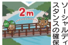
ソーシャルディスタンスの確保