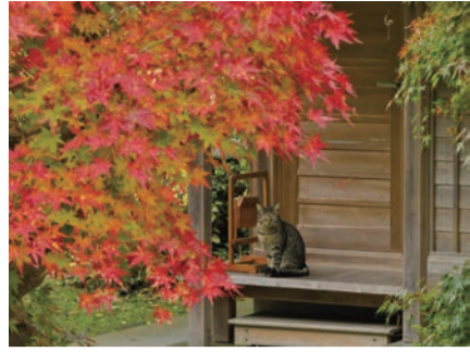
第11回(秋・冬の部) 【金賞】猫に紅葉(Hideさん)

秋川溪谷の四季折々の自然や年中行事、里山やまちの風景などを撮影した作品(デジタル画像)を募集します。