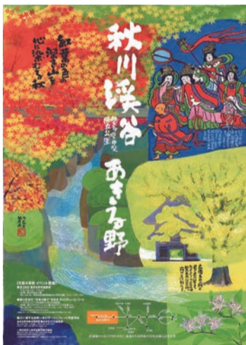
2022秋の観光ポスター