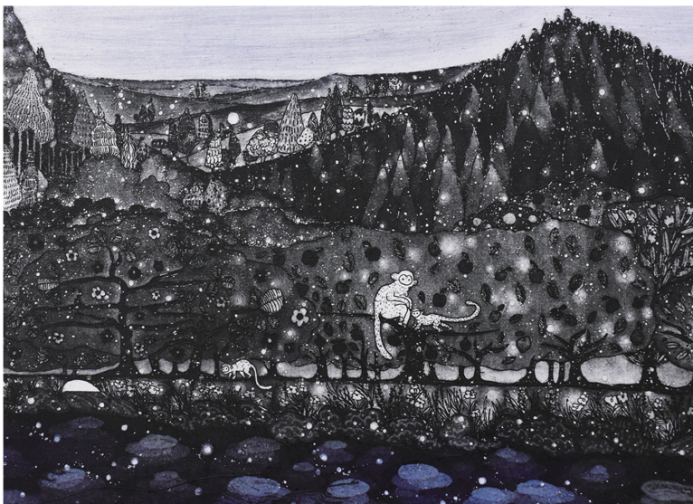
張 韡 ZHANG Wei