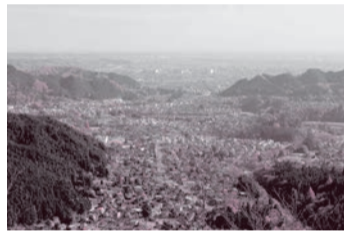
城山から望むあきる野市

3点目として、魅力発信の強化についてであります。各種施策の推進を通じて高められた本市の魅力につきましては、市内外に発信し、定住人口や交流人口、関係人口の増加を図るとともに、地域活性化につなげていくことが重要です。このため、魅力発信に当たりましては、目的と対象を明確にし、対象に応じた情報発信の方法を選択することにより、移住・定住に向けた効果的なシテイプロモーションに取り組んでまいります。