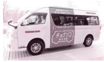
実証実験中の デマンド型交通(チョイスコ)

さらに、既存の公共交通機関の利便性の維持向上のため、交通事業者に対し、必要な働きかけを行ってまいります。