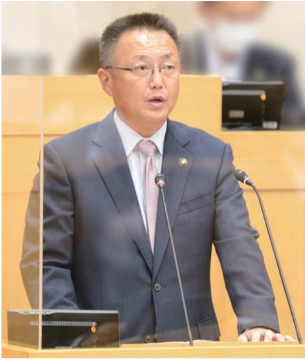
所信を表明する中嶋市長