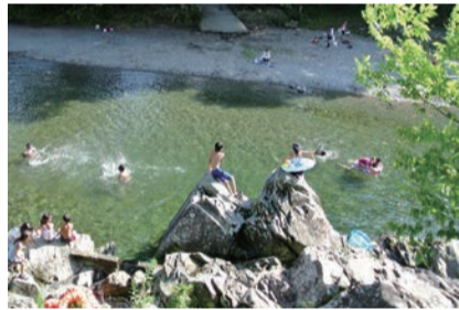
秋川で遊ぶ子どもたち

また、本市においては、地域の商店会等を中心に、空き家・空き店舗を活用した取組や商店街リノベーション支援事業などを通じて、商店会等の自発的な活性化の取組や若者の起業等の支援を行っており、実際に、若者の起業等に至った事例も増えておりますので、活性化の取組や起業等が更に活発に展開されるよう、必要な支援等を行い、意欲ある若者の移住や起業を促