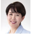
大久保 昌代 (公明党)