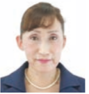
原田ひろこ (公明党)