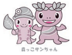
緑っこサンちゃん