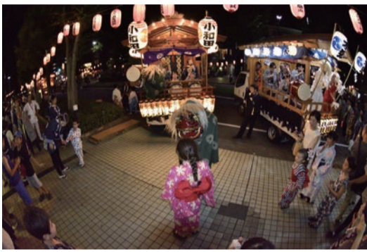
第10回(春・夏の部) 金賞受賞作品「赤紫のゆかた」