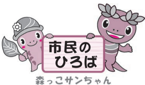
森っこサンちゃん ※詳しくは、各団体へお問い合わせください。

内国は、労働現場などで安全意識の高揚や安全活動を定着させるため、「安全は、急がず焦らず怠らず」をスローガンとする全国安全週間を、7月7日まで実施します。労働災害が起きぬよう、職場環境の整備や労働者の意識啓発などに取り組みましょう。問青梅労働基準監督署(☎0428・28・0331)