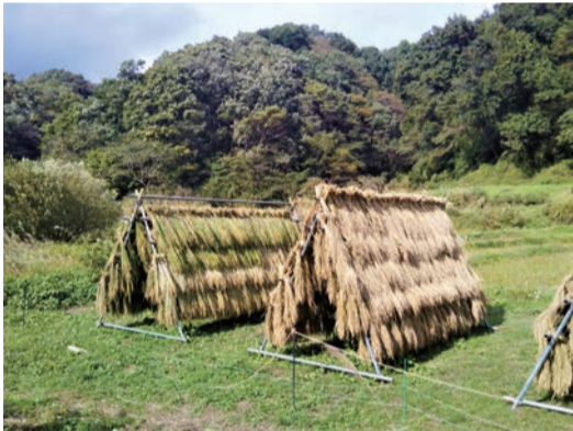
第12回金賞受賞作品 「残したい風景」