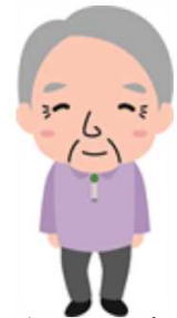
Bさん 70代 男性

将来の事を考えるとこのサービスは非常に有効的なので 今友達に広めて少しでも利用者が増えるよう努力してます。 予約するのも簡単なので安心です。