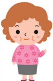
Cさん 60代 女性

病院に行くのに利用してみました。 行きは良いのですが、終わりの時間が確定していないため、 帰りの予約を取るのが難しかったけど、 余裕をもって予約 していたため乗り遅れることなく乗車し帰宅できました。