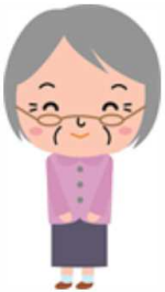
Aさん 70代 女性

今まで家族の人に頼んで買い物とかお医者さんに行っておりましたが、今は気兼ねなく使えて便利です。 お財布に優しい運賃で乗車できるサービスで助かってます。