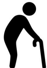
匿名 50代 性別不詳

「免許の返納をした場合の交通については今のままだと厳しい と思います。現実的に考えると市役所に用事があったり、 通院したりと出かける時には、ついでに銀行や買物に行きたい。 ということはよくあると思います。大きな道路やバス停 に近くない市民のために、デマンド型交通に期待します。」