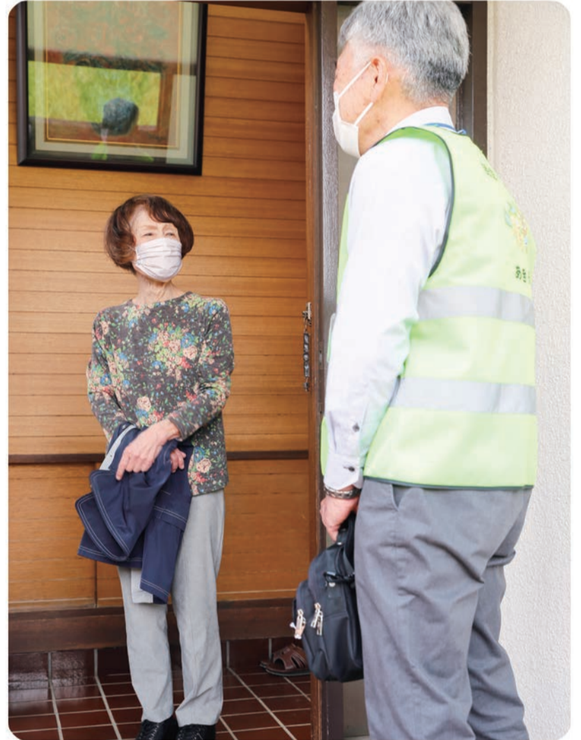
担当地区のご家庭を訪問する民生委員・児童委員(右)