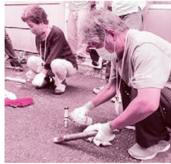
昨年度の「市民企画講座」での様子