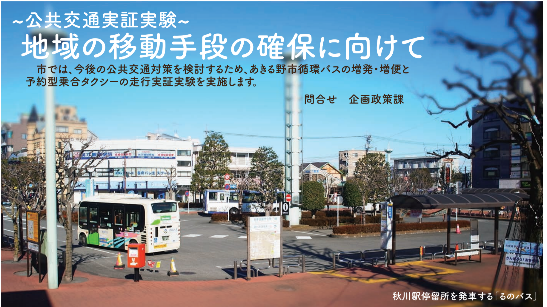
秋川駅停留所を発車する「るのバス」