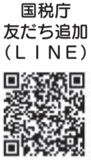
国税庁 友だち追加 (LINE)