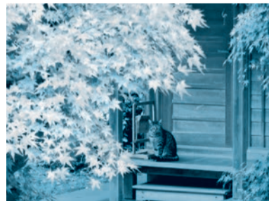
第11回金賞受賞作品 「猫に紅葉」