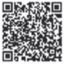
スマホ申告の動画

電子申告を推進するため、スマホ申告の方法を税務署職員が解説するスマホ申告講習会を開