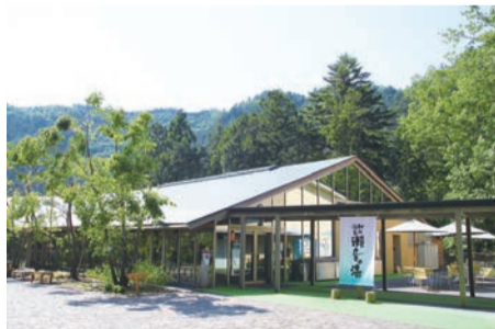
秋川渓谷瀬音の湯