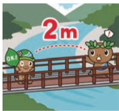
ソーシャルディスタンスの確保