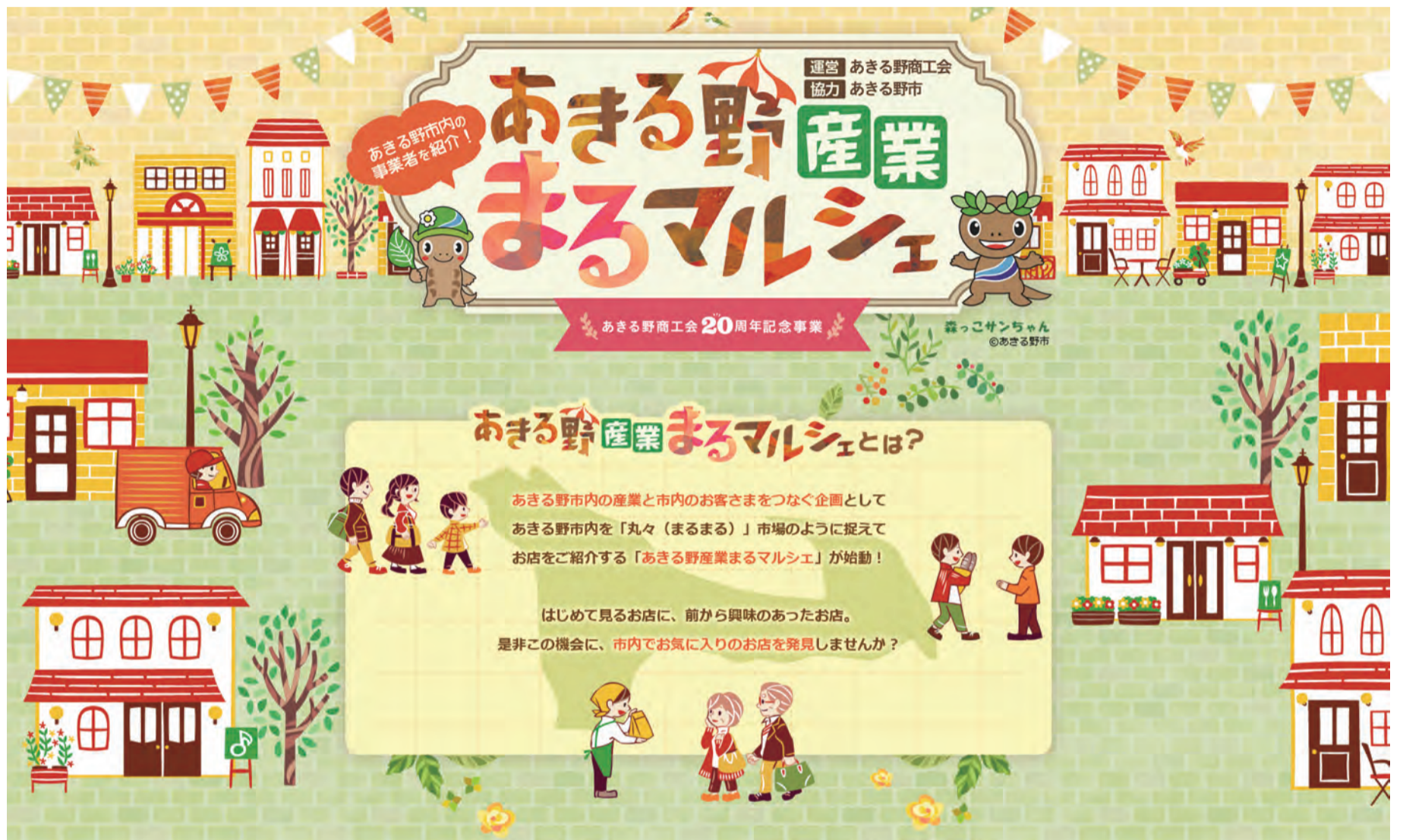
あきる野産業まるマルシェのチラシ、ホームページのイメージ

市では、新型コロナウイルス感染症の影響を受けている事業者を応援するため、あきる野商工会が市内の事業者を紹介する「あきる野産業まるマルシェ」の作成に協力しました。この機会に、紹介するお店を利用して事業者を応援しましょう。 ※事業者の紹介など、詳しくは、11月下旬から市内に全戸配布するチラシや、あきる野産業まるマルシェのホームページをご覧ください。