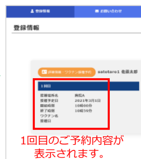
1回目のご予約内容が表示されます。