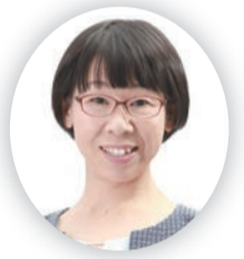
関口 江利子 55歳/日本共産党/ 新/草花