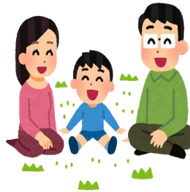
人口密度(令和2年1月1日) 1Km 2 あたり1,099人