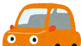
自動車保有台数(平成29年度末) 1世帯当たり0.8台