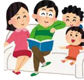
世帯員(令和2年1月1日) 1世帯当たり2.2人