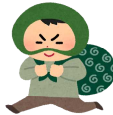
犯罪(平成30年) 1日に5.0件 (五日市・福生警察署管内)