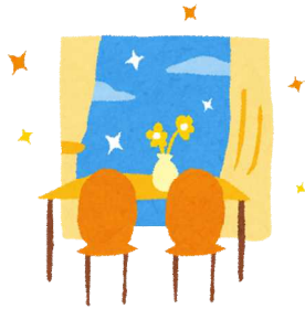
転入(令和元年) 1日に8.0人