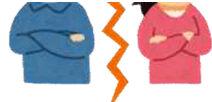
離婚(平成30年度) 1日に0.4組