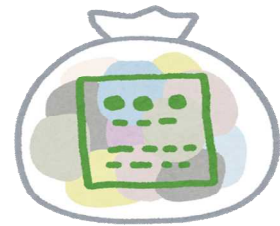
ゴミ(平成30年度) 1日に63.3t