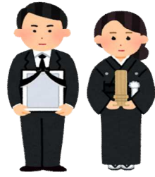
死亡(令和元年) 1日に2.7人