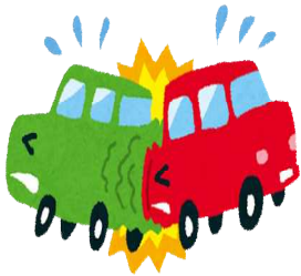
交通事故(平成30年) 1日に2.6件 (五日市・福生警察署管内)