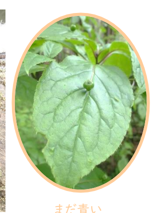
まだ青いハナイカダの果実