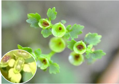
ネコノメソウの仲間 名の由来は果実(蒴果)の 形が瞳孔を閉じた猫の 目(瞳)に似ることから。 果実は完熟すると開き 、種子は雨滴によって 散布される。