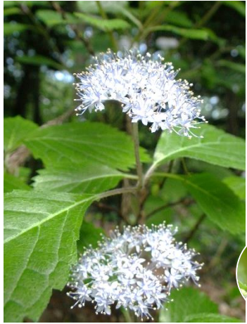
コアジサイ 花は、湿度の高いこの時季 に尚一層香しい。

森も里も多様な動植物で賑わう季節ですが 山へ出かける際は天気予報の確認と 雨具等の装備を必ず持参しましょう