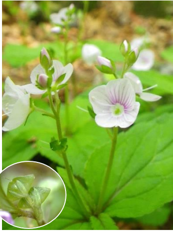
クワガタソウ 名の由来は果実が かぶとの鍬形に似ることから。