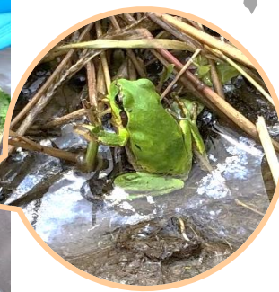
ニホンアマガエルいたよ~