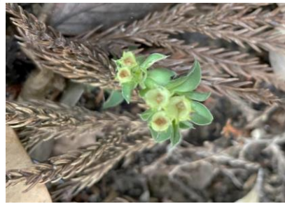
リンドウの仲間 春に咲くフデリンドウ の果実(蒴果)は雨が 降ると開き、中に入っ ている種子は雨滴によ って散布される。