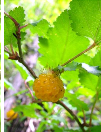
モミジチゴ 名の由来は葉がモミジに似る ことから。果実は他のキイチゴ 類同様、野生動物に人気。