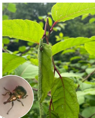
小さな甲虫たち 美しい体色のドロハマキョウ キリ(約0.8cm)が、ゆりかご 作成中。産卵のため、大きな イタドリ(約6~15cm)を巻い て作るなんて驚きです！