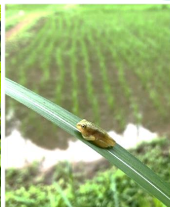
上陸する両生類 シュレーゲルアオガエルや ニホンアマガエルの幼体が そろそろ上陸する頃です。 池や田んぼの周辺は、ゆっ くり注意して歩きましょう。