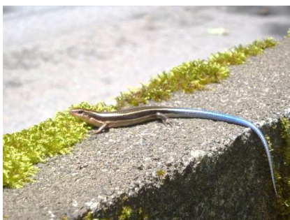
日向ぼっこ中の爬虫類 ヒガシニホトカゲなどの 爬虫類に出会うと、更に 嬉しい梅雨の晴れ間♪ 毒を持つマムシやヤマカ ガシ等のへびも出てきま すので、注意しましょう。