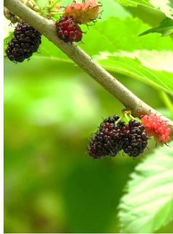
ヤマゲウ かつて養蚕用に栽培もされた。 果実はサル、タヌキ、野鳥等の 野生動物に人気。