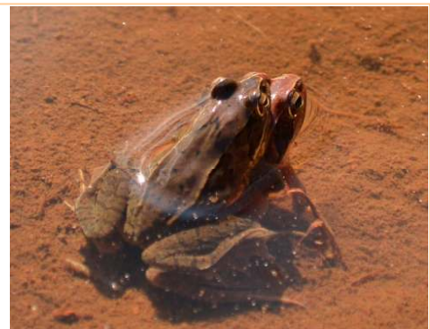
抱接中のニホンアカガエル (2月18日 横沢入)