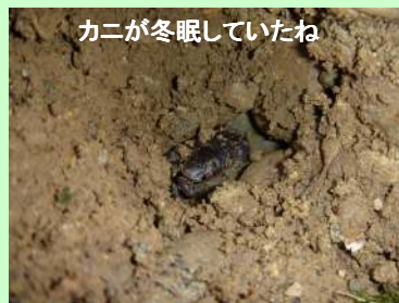
カニが冬眠していたわ