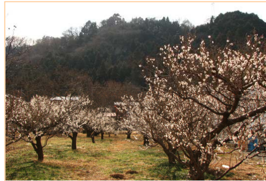
五日市周辺の梅林 (2月14日)

2月になり、市内各地で梅が開花し、見ごろを迎えています。桜の花ほどは目立ちませんが、梅の花の香りは一番。