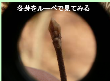
冬芽をルーペで見てみる