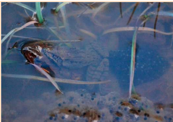
抱接・産卵中のヤマアカガエル (2月18日 横沢入)

2月17日の嵐を合図に、市内でアカガエルの産卵が始まりました。今年の冬は乾燥しすぎたため、ヤマアカガエルの産卵は、例年よりも2週間程度遅れました。そのため、2月中旬に産卵を始めるニホンアカガエルと重なって、両種類の産卵の初日を同時に観察することができました。