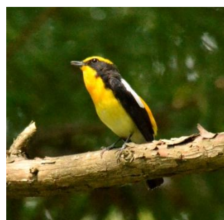
キビタキ 菅生4月24日に 初確認。

3月28日に飛来してきたサシバを初確認しました。あきる野では、毎年1~2つがいただけ繁殖し、里山環境と深い絆を持つとても重要な猛禽類です。現在は繁殖に伴い、活発に活動しています。写真は、オスがネズミを捕まえてきた様子です。