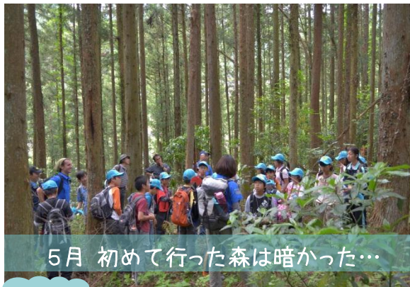
5月 初めて行った森は暗かった…