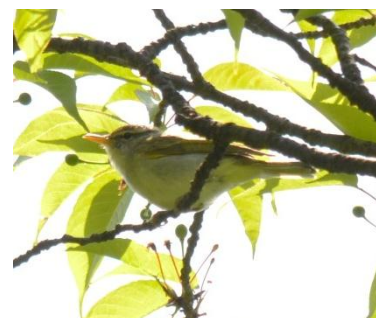
センダイムシクイ 網代4月16日 に初確認。