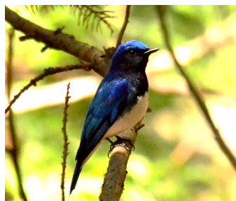
オオルリ 盆堀4月19日 に初確認。