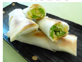
焼きたてバリバリ！ 焼き春巻き