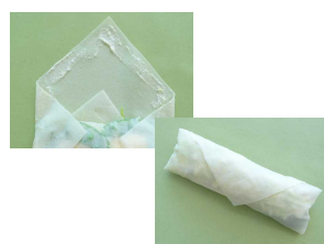
④塗ったところを接着する