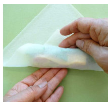
②手前を具にかぶせ ぎゅっとしめる