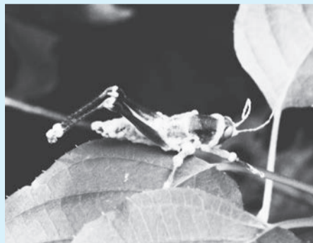
(ポーベリア菌に侵されたコバネイナゴ)

虫を駆除するとき、殺虫剤を使います。畑の作物害虫やゴキブリなどの不快害虫駆除など様々な場面で殺虫剤が使われています。一般的な殺虫剤は二つの代表的な作用経路があります。一つは直接吹きかける「接触殺虫剤」、もう一つは一度植物に殺虫成分を取り込ませて、葉の摂食や吸汁によって作用する「浸透移行性殺虫剤」です。薬剤には様々なものがあり、近年は人工的なものとは別に「バイオ農薬」といわれる自然由来のものも登場しています。自然由来の薬剤は、環境への負荷が少なく人間への毒性も少ないといわれています。さらに最近では、ポーベリア菌(昆虫病原糸状菌)というカビを使う殺虫剤があります。すでに商品化されており、マット状の菌床を木に巻き付けておき、その上を主にカミキリムシ(マツノマダラカミキリや果樹害虫)に歩かせて、菌に感染させ殺虫する仕組みのものがあります。ポーベリア菌のように生きている昆虫に感染する菌類で有名なものには、漢方薬の「冬虫夏草(キノコ)」がありますが、ポーベリア菌はカビの仲間、昆虫からキノコを出すことはありません。感染すると、体節から白いワタ状のカビが広がります。体内では菌糸が広がり、昆虫の体液を養分にしていきます。このポーベリア菌は、あきる野の自然界でも見られる菌(カビ)で、様々な昆虫に感染して殺虫します。不思議なことに多くの場合、感染した昆虫が草や藪の高い所に向かいます。