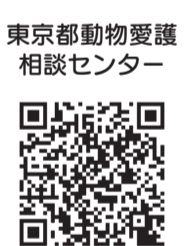
東京都動物愛護相談センター

出ている場合は、収集しません。袋を2枚使用しての排出は、できません。 ▽問合せ 生活環境課清掃・リサイクル係(直通558・1830)