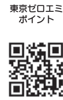
東京ゼロエミッションポイント