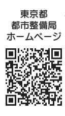
東京都 都市整備局 ホームページ

極めて悪質な犯行手口の「アポ電強盗」が発生しています 内家族などを装い自宅にある現金の額を確認するいわゆる「アポ電」に対して、お金がある用意できることを伝えた数日後、犯人に押し入れられた現金を奪われる強盗被害が連続発生しています。○手口、「自宅の現金保管状況や預貯金額」を聴きだす：息子や孫を装った犯人が、「様々な嘘のトラブルを口実で、お金が急に必要になったので、貸して欲しい。いくら準備できるか。」などと電話でだまして聴きだします。「金融機関と預貯金額、通帳やキャッシュカードの暗証番号」を聴きだす：警察官を装った犯人が「キャッシュカードが不正に利用されている可能性があります。捜査に必要なため、金融機関と預貯金額、暗証番号を教えてください。」などの嘘の捜査を口実に電話でだまして聴きだします。※手口は様々です。○対策・相手は誰であろうと電話で資産状況を伝えない。固定電話利用の際は「電話がかかってきても相手が分からない場合は出ない」「家族や知人などの必要な相手には自分からかける」。犯人からの電話であることが分かったらすぐに切つて警察に連絡する。※ためらわずに110番通報してください。/問地域防災課交通防犯係 五日市警察署 ☎595・0110、福生警察署 ☎551・0110