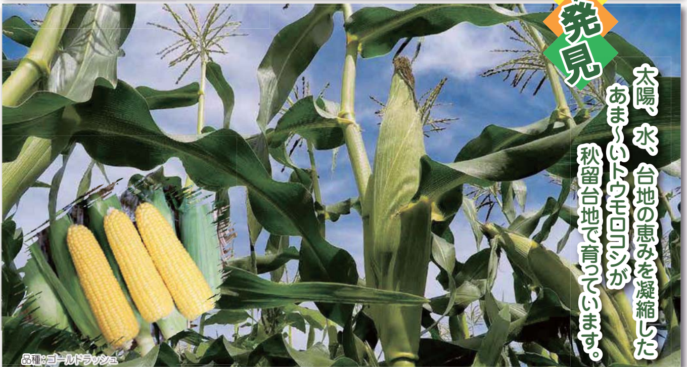
品種:ゴールドラッシュ

太陽、水、台地の恵みを凝縮した あま〜いトウモロコシが 秋留台地で育っています。