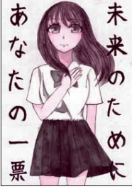
未来のため あなたの一票