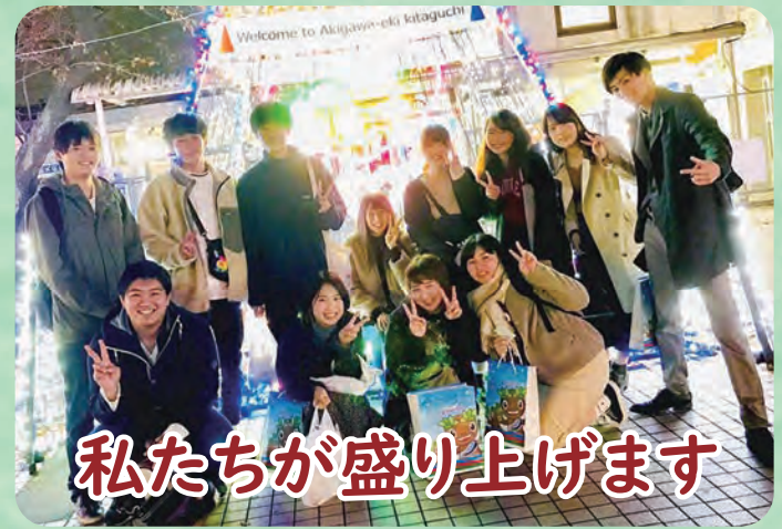
私たちが盛り上げます

市では、（学）明星学苑明星大学と締結している「包括的な相互協力・連携に関する協定」に基づき、あきる野商工会や秋川駅周辺地区産業活性化戦略委員会などと連携し、学生の目線で「まち」を盛り上げるための活動を支援しています。