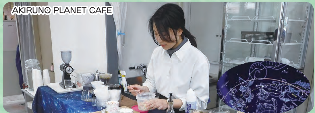
AKIRUNO PLANET CAFE

市内の協力店舗と学生がアイデアを出し合い、地元の食材を使用した限定スイーツ販売やプラネタリウムを上映しました。