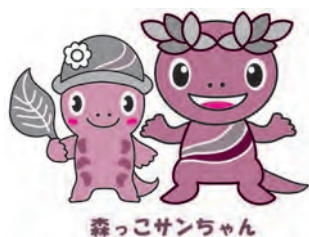
森っこサンちゃん

▽チラシ兼申込書配置場所 小宮ふるさと自然体験学校、環境政策課(五日市出張所)、生活環境課、中央図書館、東部図書館エール、五日市図書館 ※市ホームページからダウンロード