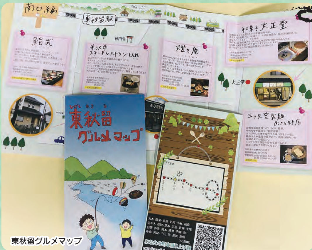
東秋留グルメマップ