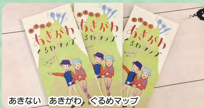
あきない あきがわ ぐるめマップ