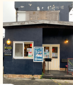
薪窯屋 YOSHIZO 本店