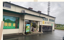
みつばちファームカフェ