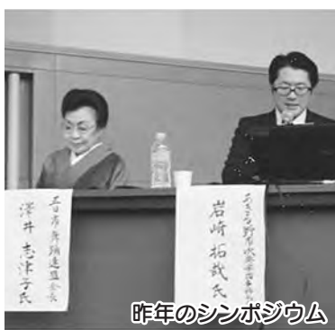
今年のシンポジウム