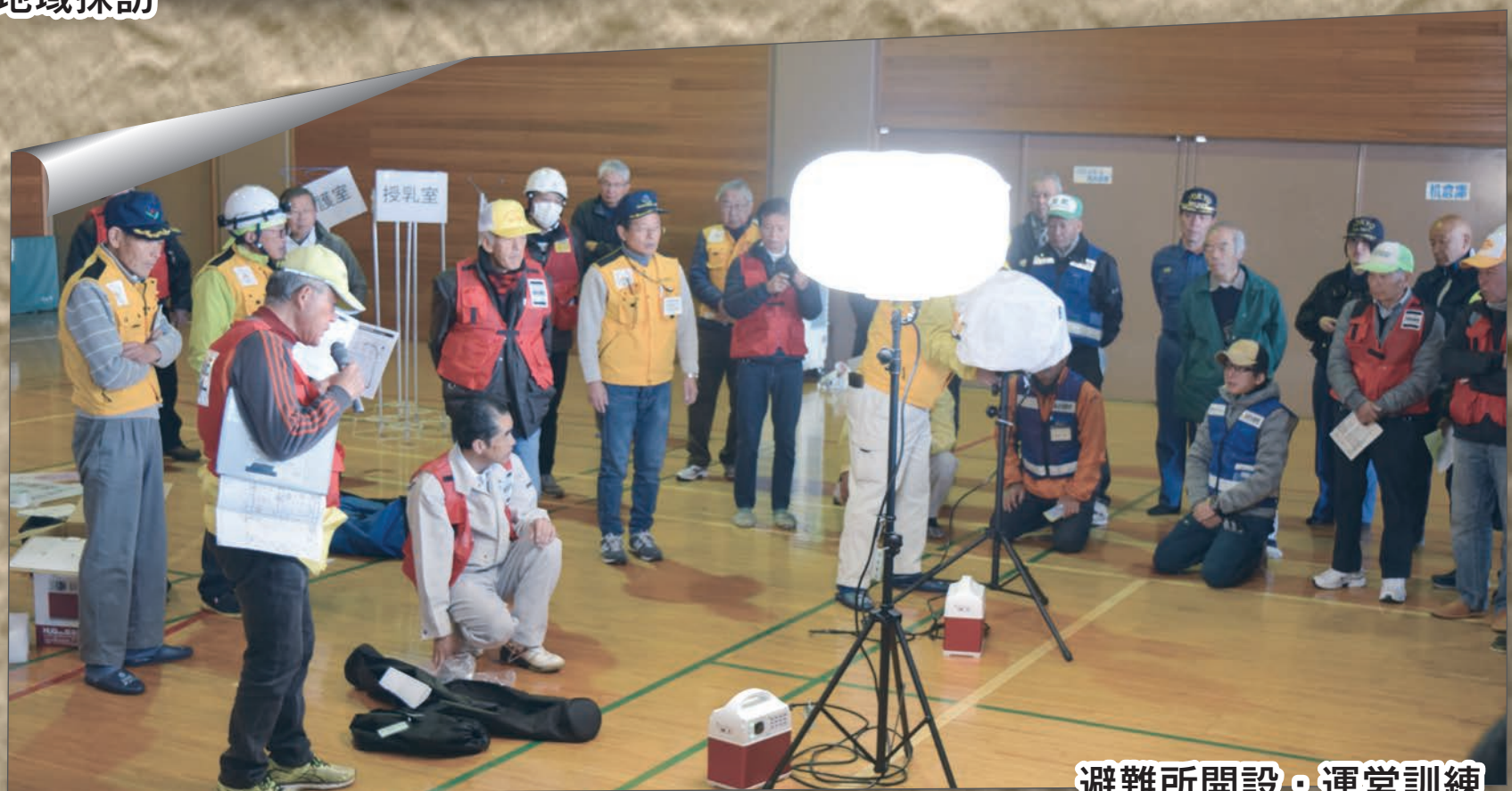
避難所開設・運営訓練