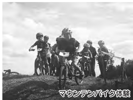
マウンテンバイク体験

マウンテンバイク友の会) ●対象:5歳から12歳までの自転車に乗れる子どもとその保護者