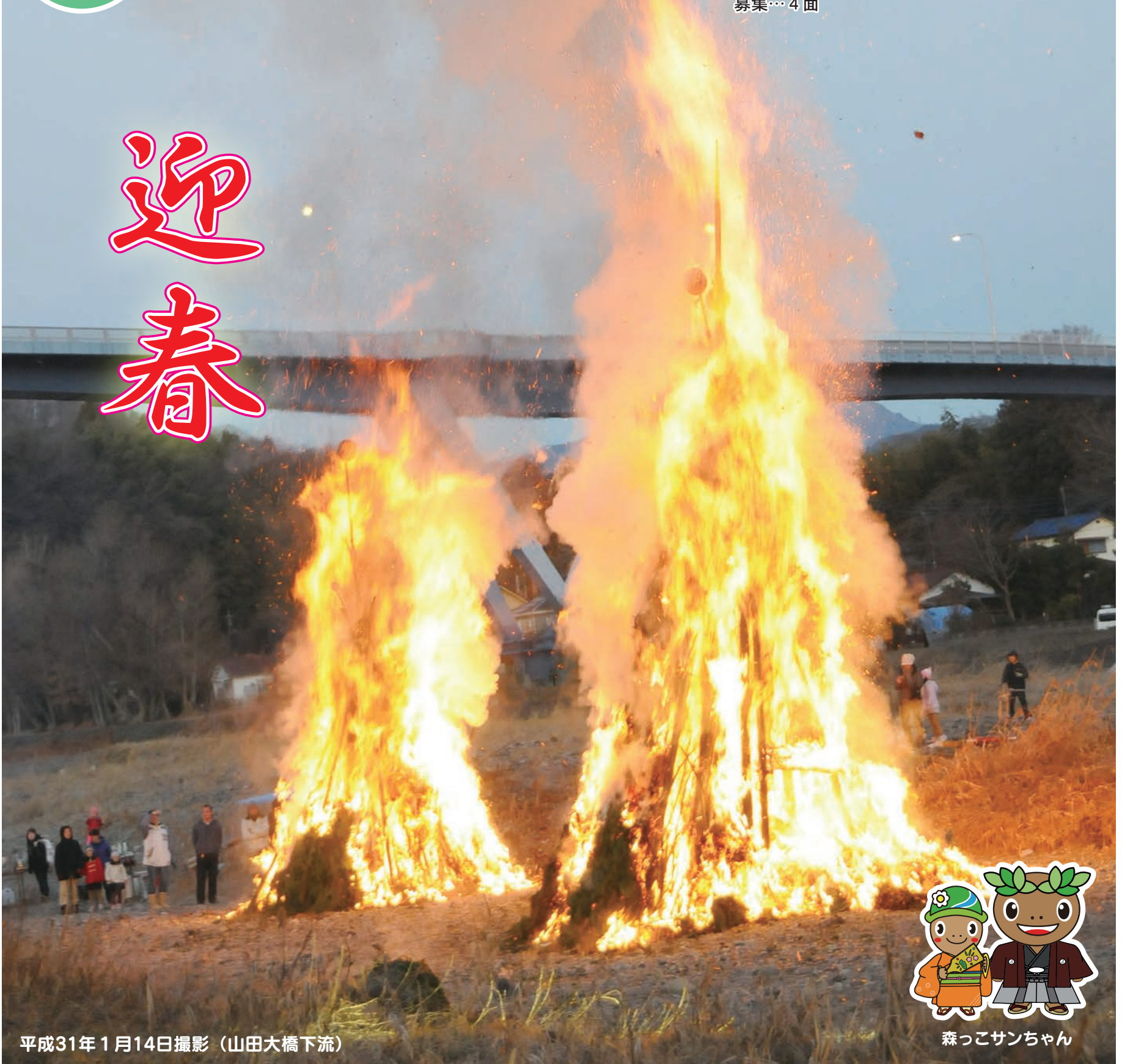
平成31年1月14日撮影 (山田大橋下流)