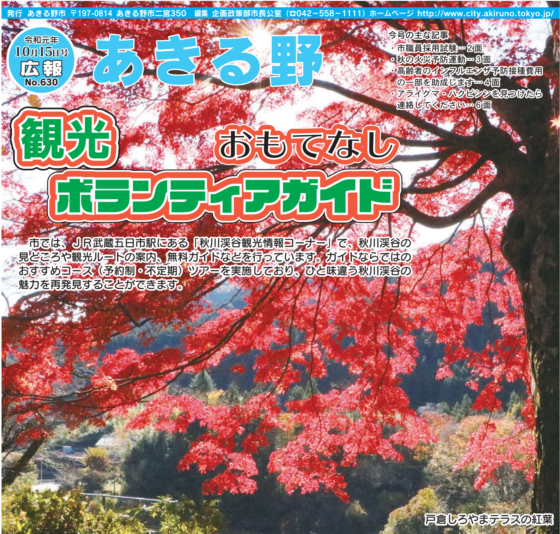
戸倉しろやまテラスの紅葉

市では、JR武蔵五日市駅にある「秋川渓谷観光情報コーナー」で、秋川渓谷の見どころや観光ルートの案内、無料ガイドなどを行っています。ガイドならではのおすすめコース（予約制・不定期）ツアーを実施しており、ひと味違う秋川渓谷の魅力を再発見することができます。