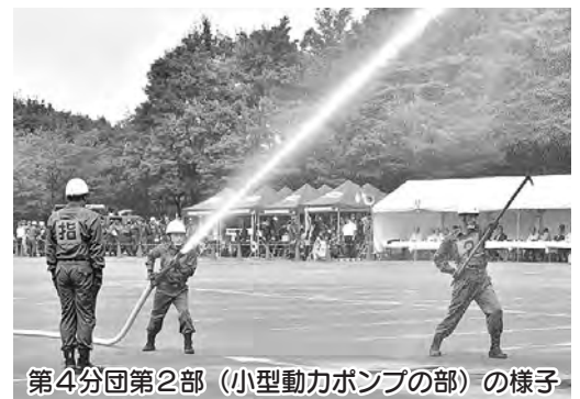
第4分団第2部(小型動力ポンプの部)の様子

9月22日に明星大学青梅キャンパスで開催され、あきる野市消防団からは第4分団第2部(小型動力ポンプの部)、第2分団第2部(自動車ポンプの部)が出場し、第4分団第2部が第3位に入賞しました。