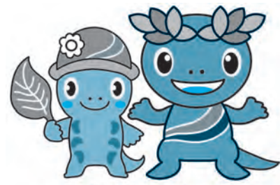
森っこサンちゃん

観光ボランティアガイドの頃の活動内容を紹介します。観光ボランティアガイドを知るよい機会ですので、お越しくさ