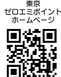
東京ゼロエミポイント ホームページ

(※考查日は令和2年1月27日(月)／場東京ビッグサイト(江東区有明3-11-1)／定400人／費2万円／他〇11月5日(火)から29日(金)までに都内各警察署交通課に申込み 〇詳しくは、警視庁ホームページ参照(予算がなくなり次第終了) 〇詳しくは、問い合わせるかホームページ参照／問〇コールセンター：☎0570・0005・083、☎03・6634・1337(9時〜17時(年末年始を除く)) 〇事務局ホームページ( https://www.zero-emipoints.jp )