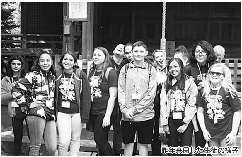
昨年来日した生徒の様子

国際姉妹都市である米国マールボロウ市のウィットコム・スクールから生徒12人と引率者3人が、10月11日(金)から21日(月)までの間、市内に滞在します。滞在中はホームステイをしながら、市立中学校に体験入学するほか、様々な交流を通じて市民との友好・親善を深めます。生徒や引率者の方を見かけた方は、声を掛けてください。