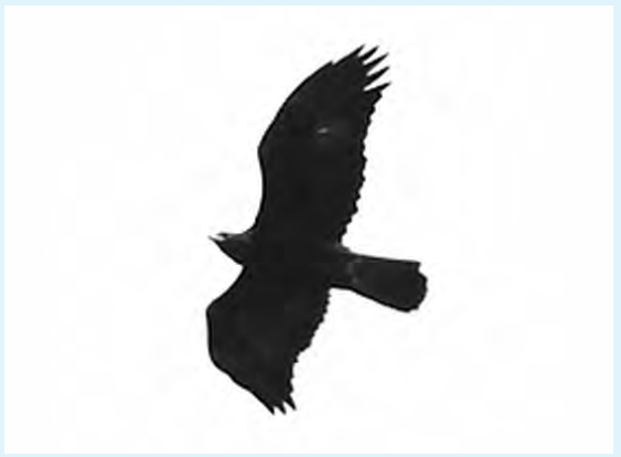
昨年、秩父多摩甲斐国立公園内で見たイヌワシ。滑空する黒い姿はまるで天狗のように見えました。

市内では、イヌワシを一度も見たことはありませんが、他の地域では存在を確認しています。近年の森林整備によって、イヌワシが生息できる自然に近づき、いつかあきる野にも飛来してくることを期待するばかりです。(パブロ)