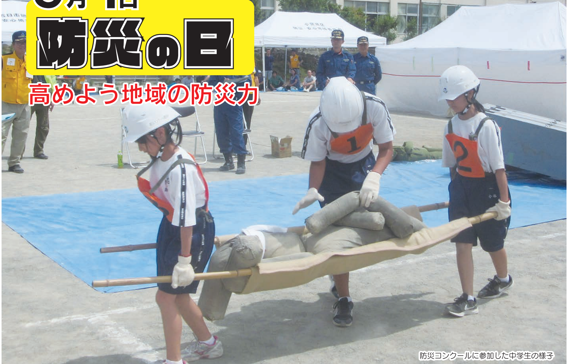
防災コンクールに参加した中学生の様子

東日本大震災などの大きな災害から、災害発生時の「地域コミュニティの助け合い（共助）」の重要性が改めて、認識されました。災害から身を守り、被害を少なくするためには、地域の防災力の向上と充実が必要です。地域では、各町内会・自治会の自主防災組織や防災・安心地域委員会が中心となり、防災力を高めるため、様々な防災活動を行っています。日ごろから、一人ひとりが防災の意識を持ち、対策を行い、継続することが、地域の防災力を高めることにつながります。