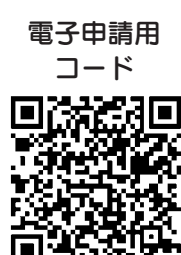
電子申請用コード