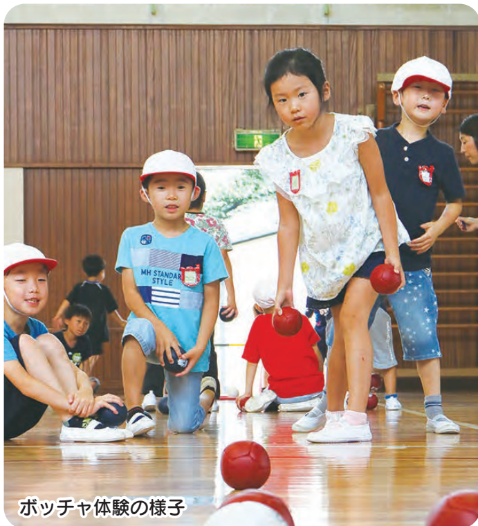
ボッチャ体験の様子