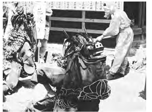
▽日時 8月18日(日) 午後1時30分