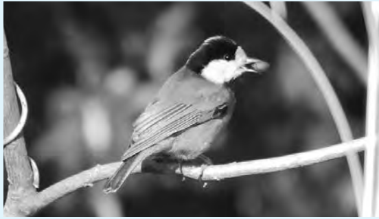
ヤマガラがエゴノキの種子をくわえている様子

エゴノキは、日本では北海道から沖縄まで広く分布し、山地や里山に普通に生える落葉広葉樹なので見たことがある方も多いと思います。名の由来は、果実を食べるとえぐいため、エゴノキになったといわれています。えぐみの成分はサポニンで、昔は若い果実を水と振り混ぜて発泡させ、洗剤として利用していました。エゴノキしてみると、種子が成熟するまで虫や動物から守る大切な成分です。そのサポニンを含む果実は、熟すと破けて茶色い種子が目立つようになります。これは、成熟した油脂たっぷりの種子をヤマガラにアピールしてい