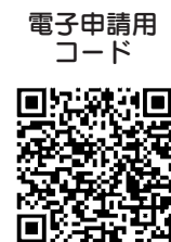
電子申請用コード

※電子申請の方は、市ホームページから申し込んでください。※スマートフォンから電子申請される方は、次のコードからアクセスしてください。 ▽申込み・問合せ 五日市郷土館(〒19010164 五日市92011、☎596・4069(火曜・水曜日は休館))