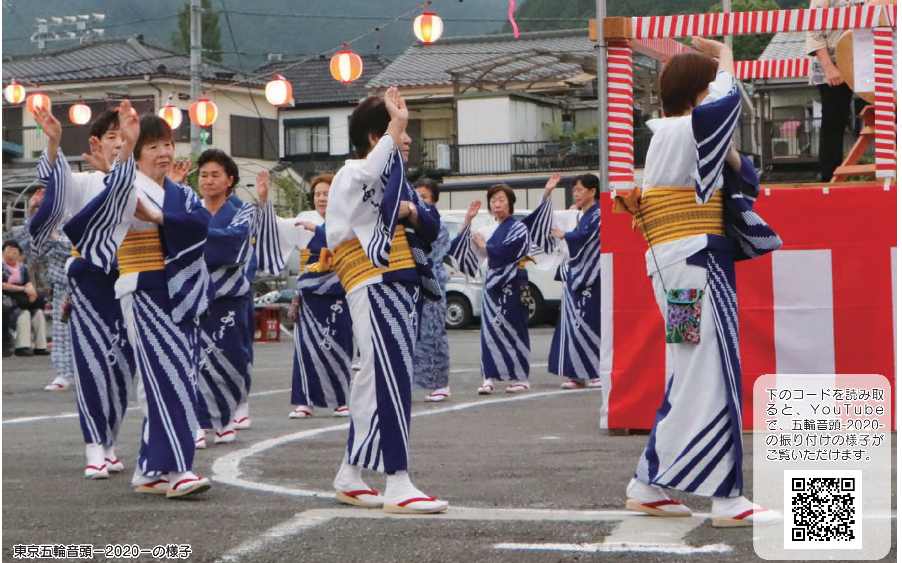
東京五輪音頭-2020-の様子

地域から「東京五輪音頭-2020-」の踊りの輪が広がっています。 あきる野夏まつりの流し踊りでは25団体約1,100人が踊ります。