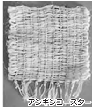
アンギンコースター

▽講座⑤ アンギンでコースターづくり ●期日:8月9日(金) ●定員:10人(抽選) ▽時間 午後1時30分～3時30分 ▽場所 二宮考古館 ▽講師 文化財係職員 ▽対象 小学生以上