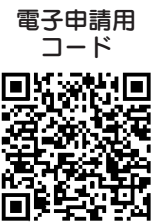
電子申請用コード

※小学校4年生以下は保護者同伴 ▽費用 各100円 ▽申込み方法 7月26日(必着)までに、往復はがきに希望する講座の番号、住所、氏名