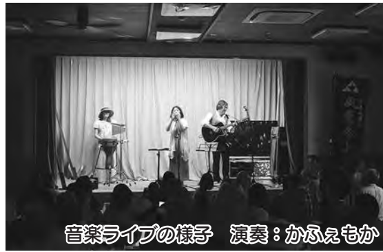
音楽ライブの様子 演奏：かふえもか

▽日時 6月30日(日) 午後6時30分～8時30分 ▽場所 養沢センター(養沢290-1) ▽内容 中央公民館 家庭で使用しているフ