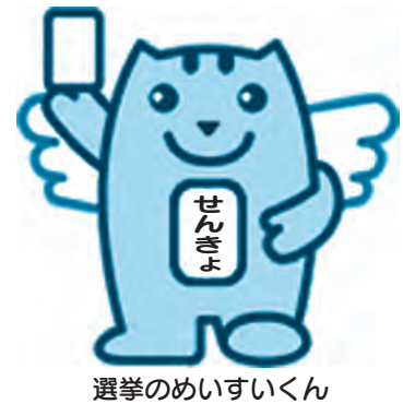
選挙のめいすいくん