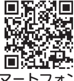
スマートフォン用