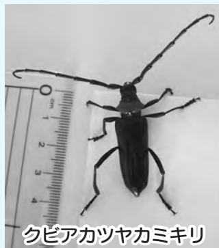
クビアカツヤカミキリ

お、捕獲した場合は、その場で処分をお願いします。 ▽成虫の特徴 体長2.5センチ前後、4.0センチ前後。全体的に光沢のある黒色で、胸部(首部)のみ赤色です。6・7月に飛翔します。 ▽寄生された樹木の特徴 サクラ、ウメ、モモ、スモモなど 5月から9月にかけて、幼虫の糞と木屑が入り混じったもの(フラス)が排出されるため、樹木の根元に茶色いひき肉状のフラスが溜まります。