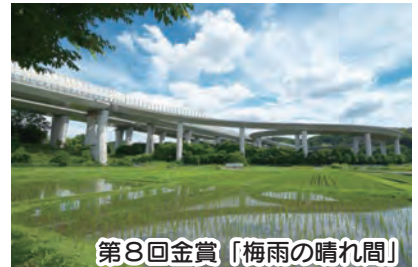
第8回金賞「梅雨の晴れ間」