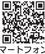
スマートフォン用