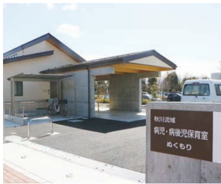
秋川流域病児・病後児保育室「ぬくもり」

▽開所日時 月曜～金曜日 午前8時～午後6時(祝日、年末年始を除く) ▽場所 「ぬくもり」(公立阿伎留医療センター敷地内北側) ▽対象 病気のため集団保育が