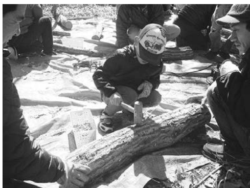
親子で体験「椎茸のホダ木づくりと駒打ち体験」

コナラを使って「椎茸のホダ木づくりと駒打ち体験」を行います。ホダ木は、持ち帰ることができます。 ※天候などで内容を変更する場合があります。 ▽日時 2月17日(日) 午前10時～午後3時 ※2月23日(土)予備日 ▽集合・解散場所 菅生若宮子ども体験の森(菅生821-1)