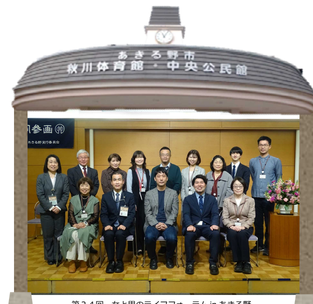
第24回 女と男のライフフォーラム in あきる野