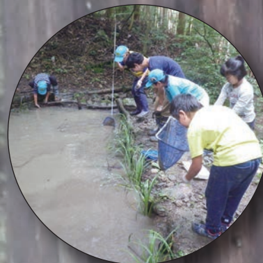
ビオトープの生物調査 (7月)