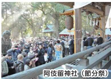
阿伎留神社(節分祭)