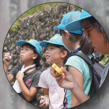
どんぐり豊凶調査 (8月)