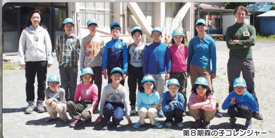
第8期森の子コレンジャー