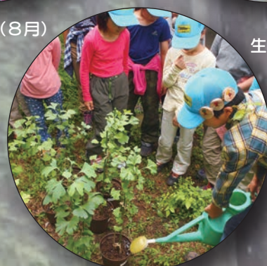
育樹祭で贈呈するイチョウの育成

豊かな恵みをもたらす森は、みんなの「共通の財産」です。市では、市域の約6割を占める森を将来の世代に引き継ぐため、「森林レンジャーあきる野」が森林パトロールや生物調査のほか、地域との協働による森づくりや森の子コレンジャー活動（環境教育）などを行っています。