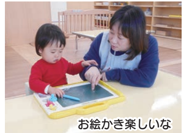
お絵かき楽しいな