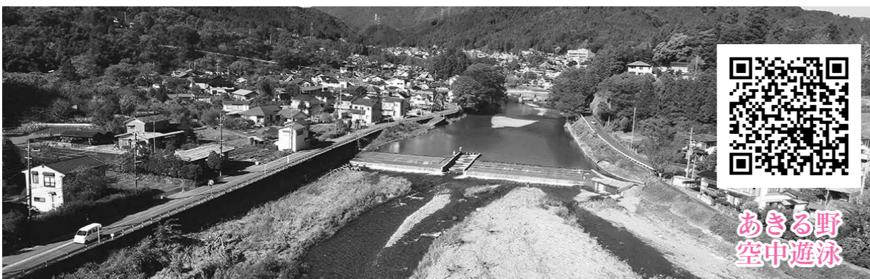
あきる野 空車遊泳

■市内の風景、市で開催するイベント、市内に生息する動植物を動画映像で記録・保存しています。撮影には、テレビ番組でも使用されるカメラのほか、ドローンやウェアラブルカメラ(身体等に装着する小型カメラ)など最新の機材を使用しています。撮影した映像は、テレビ番組などにも提供しています。