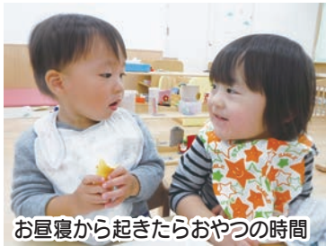
お昼寝から起きたらおやつ時間