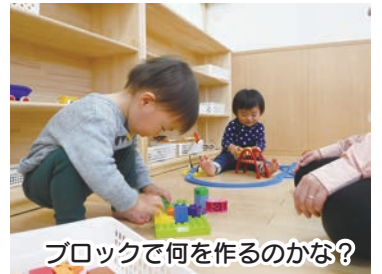
ブロックで何を作るのかな?

※利用は、月曜日から土曜日まで(第3水曜日、祝日、年末年始を除く) 午前10時～午後4時 詳しくは、お問い合わせください。 ○問合せ 子育てひろば こころの(乳幼児一時預かり担当) ☎550-3314