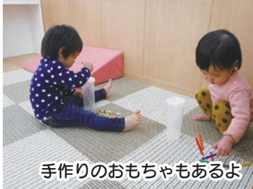
手作りのおもちゃもあるよ

昨年4月に開所した、子育てひろば「こころの」内の乳幼児一時預かりスペースでは、子育て中の保護者の方にリフレッシュしていただくため、お子さんをお預かりしています。子どもたちはブロックで遊んだり、公園を散歩したり、おやつを食べたりして、楽しく過ごしています。