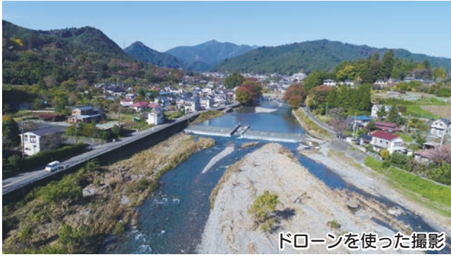
ドローンを使った撮影