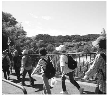
金比羅山で紅葉を楽しみました。