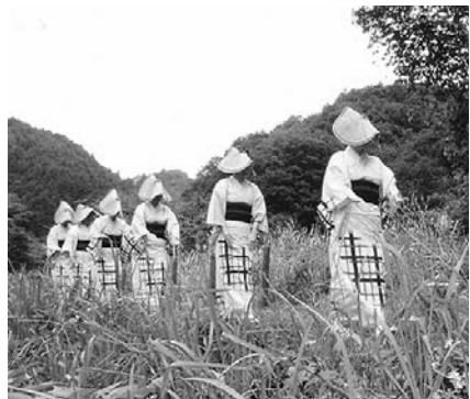
横沢入里山保全地区では、水田を復活させてから12年が経過

●日時：10月14日(日) 午後1時～3時 ●定員：6人 ●費用：2千円 ▽ガラスフュージングで小物作り ●日時：10月22日(月) 午後1時～3時 ●定員：10人 ●費用：2千円(材料費込) ●その他：完成まで1週間かかります。 ▽ハーバリウム&ボールペン ●日時：10月20日(土) 午後1時～3時 ●定員：20人 ●費用：1800円から、各種